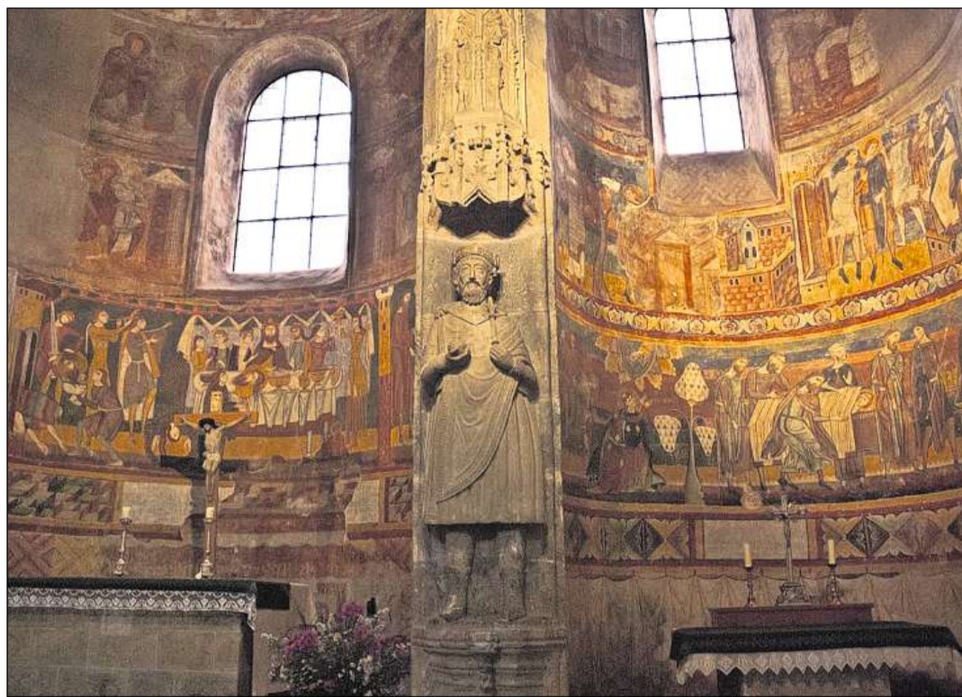
Frescos e statua da Carl il Grond en la claustra da Müstair.