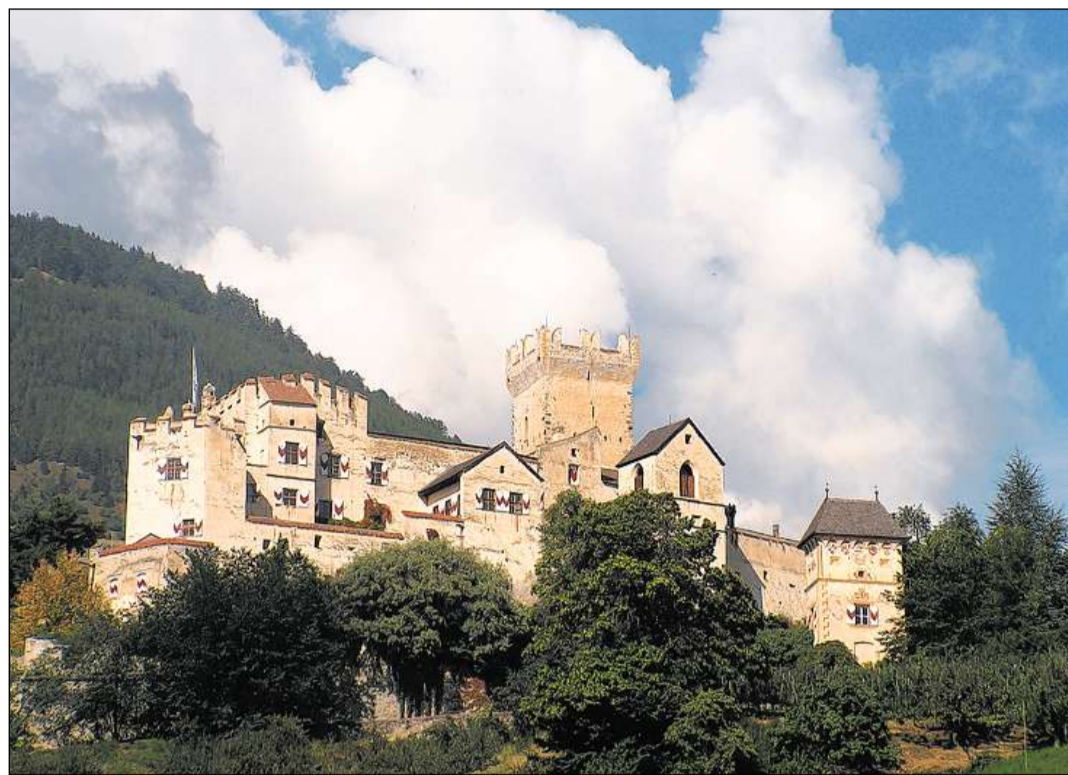
La Churburg a Schluderns regorda a l'anterior domini territorial dal prinzi-uestg da Cuira en il Vnuost. FOTO PD